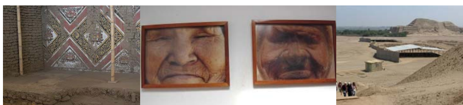
Huacas del Norte, Perú

Del conocimiento en viaje se han desprendido una serie de iniciativas, redes de acción y estudios que prolongan la experiencia de la Ruta y profundizan en los desafíos propios del desarrollo territorial basado en la identidad cultural. En ese sentido cabe destacar la presentación de un video documental de la experiencia expuesto durante el Taller Internacional "Valorización de la Identidad Cultural en Territorios Rurales: Experiencias y Perspectiva" realizado en Cartagena de Indias Colombia, la pronta activación de una Comunidad de Aprendizaje Virtual para el reforzamiento y la puesta en práctica de lo aprendido y la planificación de una segunda Ruta.