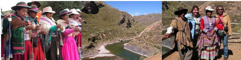
Valle del Colca - Perú

La experiencia directa e in situ primero en Perú, en el Valle del Colca y después en Huacas del Norte del Perú y luego en Chile, en el Archipiélago de Chiloé se enriqueció a cada paso con talleres y estimulantes espacios de dinámica discusión que fortalecieron los procesos de aprendizaje.